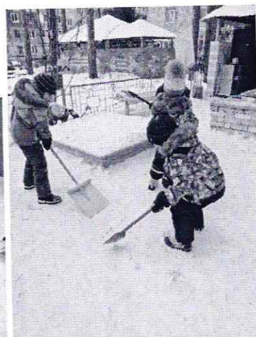
Структурное подразделение «Ласточка»