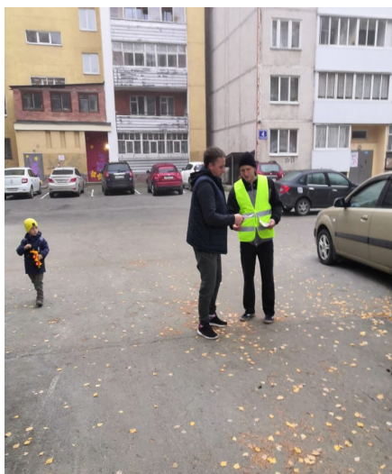
Фото проведения мероприятия «Родительский патруль»